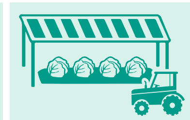
営農型太陽光（ソーラーシェアリング）