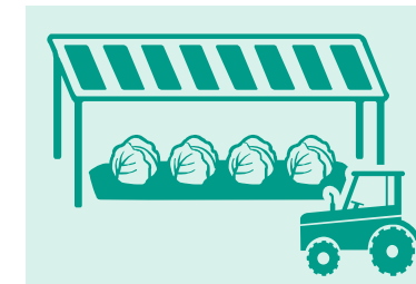
営農型太陽光（ソーラーシェアリング）