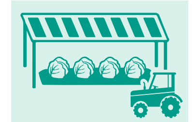
営農型太陽光（ソーラーシェアリング）