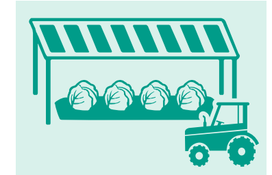
営農型太陽光（ソーラーシェアリング）